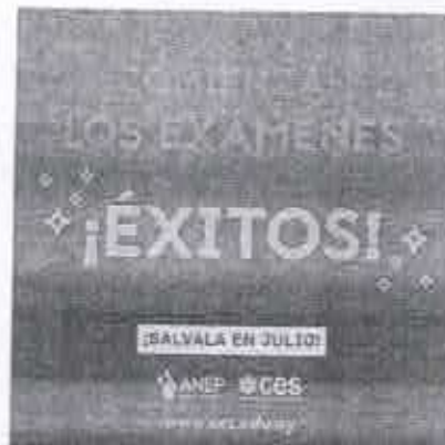
Salvala en julio Comienza el período de exámenes ¡Éxitos!