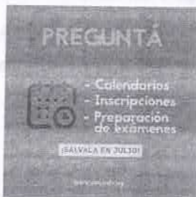
Salvala en Julio Informate en tu liceo Calendarios Inscripciones Preparación de exámenes