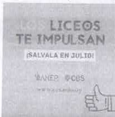
Los liceos te impulsan Salvala en julio